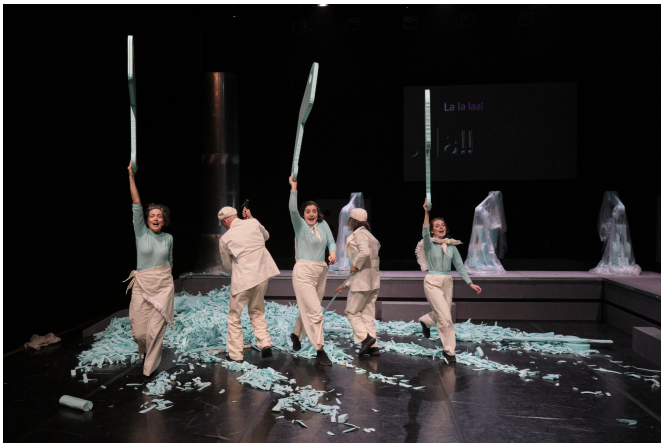
Bora Lá Laborar!