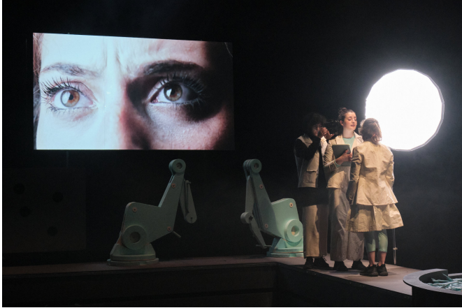
Bora Lá Laborar!