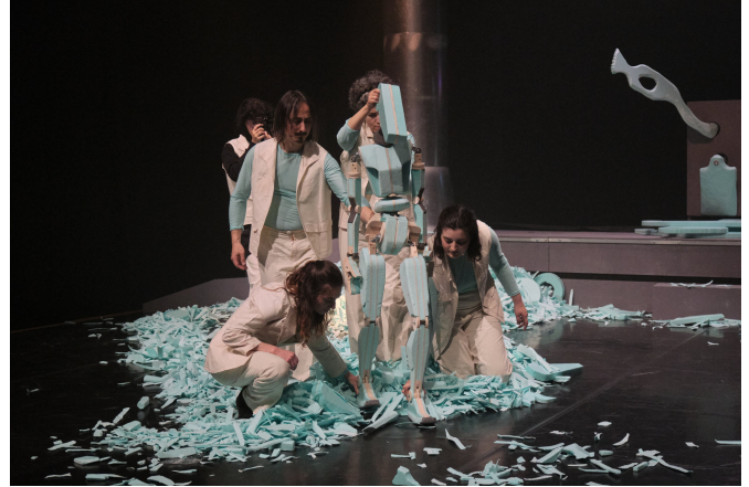
Bora Lá Laborar!