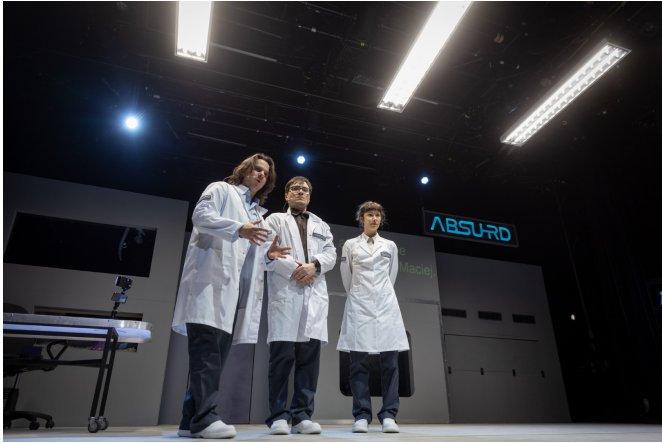
ER I © Wojciech Wojtkielewicz