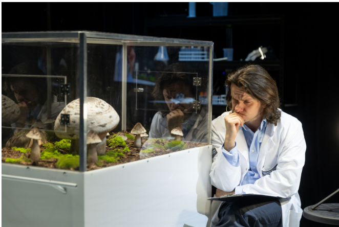
ER III