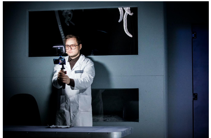
ER IV © Wojciech Wojtkielewicz